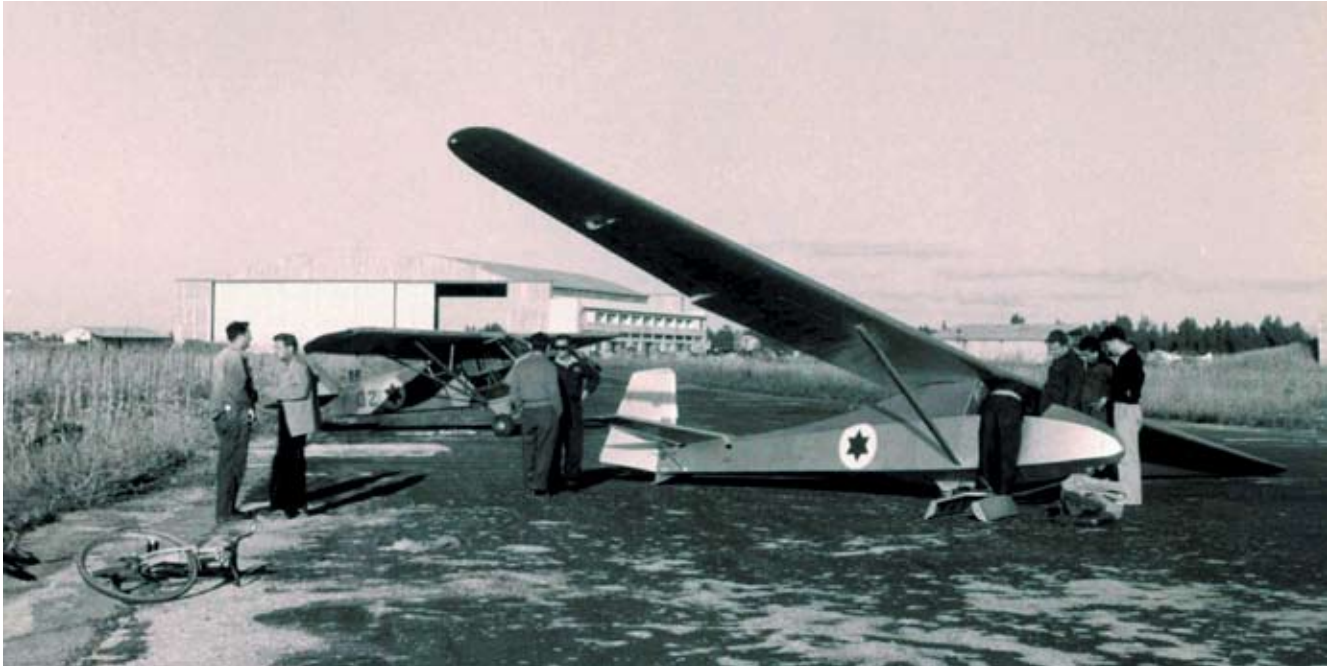
מכונאים וטכנאים מכינים אחד מדאוני "סלינגסבי פריפקט" לטיסת ניסוי

התעופה לישראל וגדנ"ע אויר. מחלקת הייצור הוקמה בפחונים בריטיים ישנים אשר הותאמו לייצור מבנים מעץ וציפויים בבד. דאוניס אלה היו עשויים שלד עץ ועטויים בבד מצופה דופ. הם נצבעו בצבעים צהובים כדאוני הדרכה. בשירותם בדגנ"ע אויר הם נשאו את סמל חיל האויר. דאוניס אלה שימשו משך שנים רבות את קלוב התעופה וגדנ"ע אויר, להכש"רת דואים, בדרכם להדרכה במטוסים הממונעים.